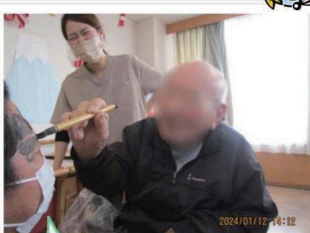
厄払い、厄払い・・・