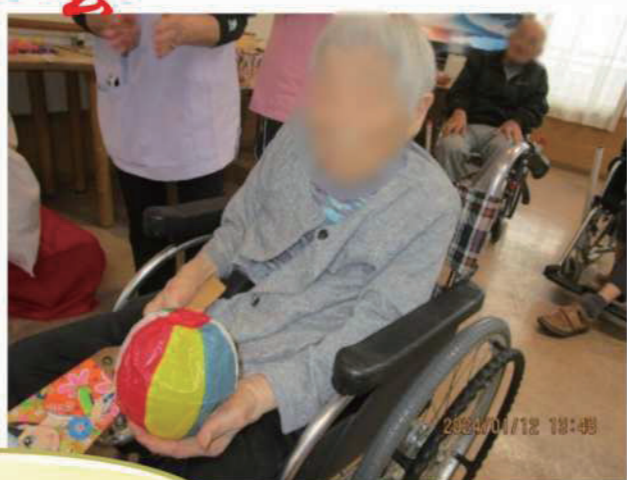
無病息災を願って羽根つき