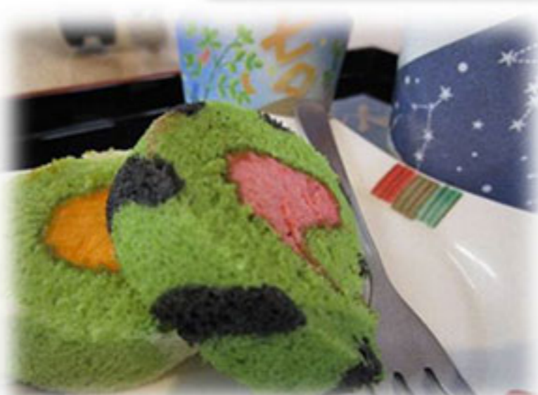
たなばたロール ～のぞみカフェ～