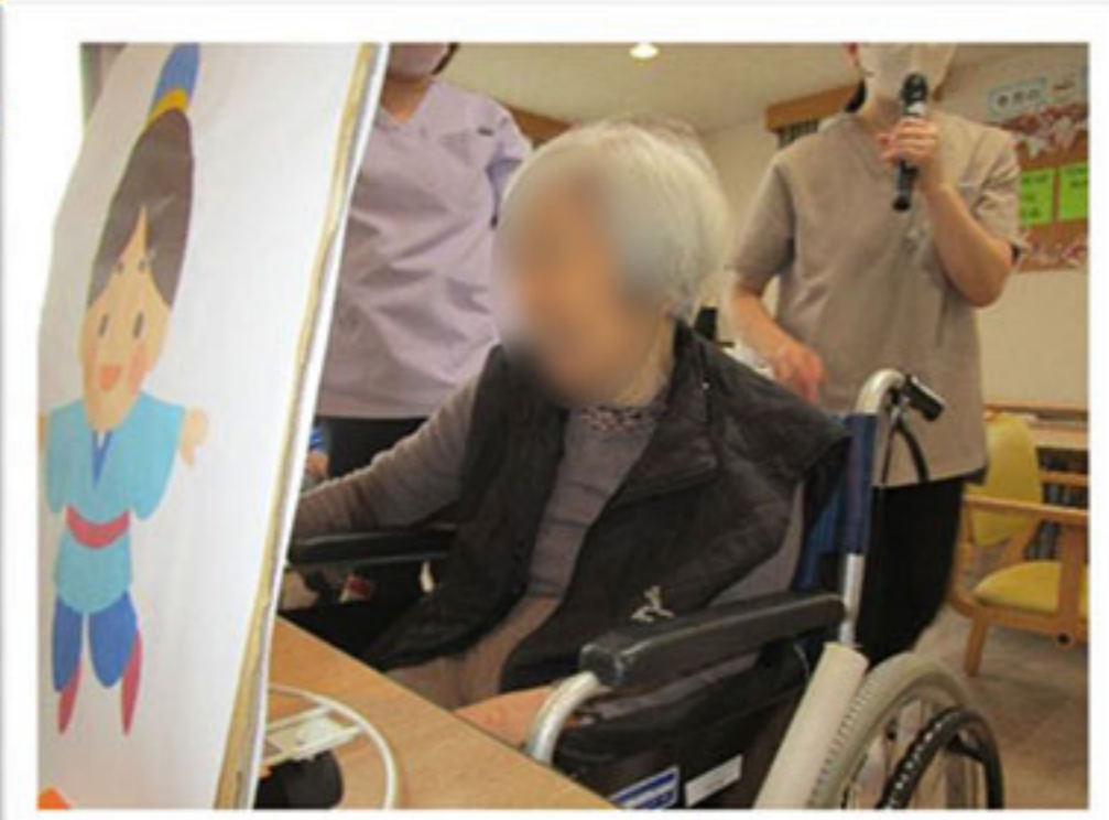
おり姫のもとへ・・・ Go!